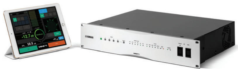
The MMP1 Studio Monitor Management System: Part of Yamaha's continuing commitment to enhancing the audio production process

Versatile, great-sounding and refreshingly affordable, the new Yamaha MMP1 brings sophisticated monitor management to DAW-based production environments. From stereo through to complex, multi-channel formats like Dolby Atmos, MMP1 delivers flexible routing of all essential audio throughout the studio, along with the powerful bass management control, time alignment delays and six-band room EQ necessary to optimise your monitoring for your production space. MMP1 is easy to configure and operate via Mac/Windows Apps, and there's also an iPad App for convenient control of all essential parameters.