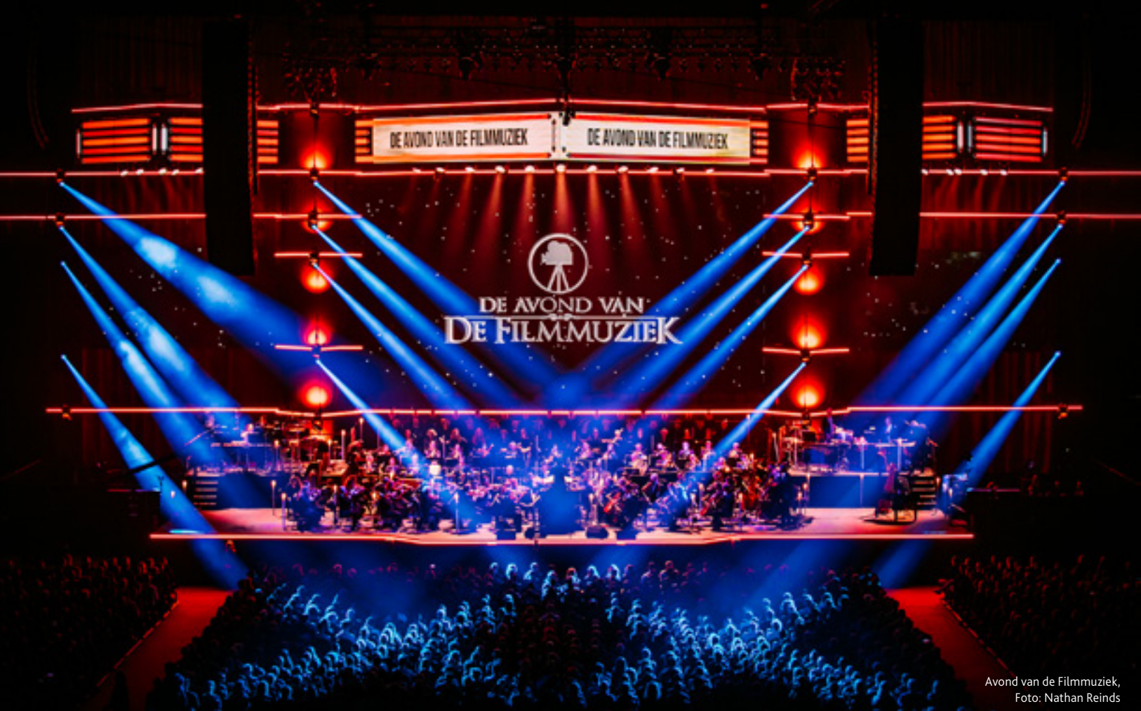
Avond van de Filmmuziek

Herpositionering na fusie Unlimited Productions en Livetime Productions