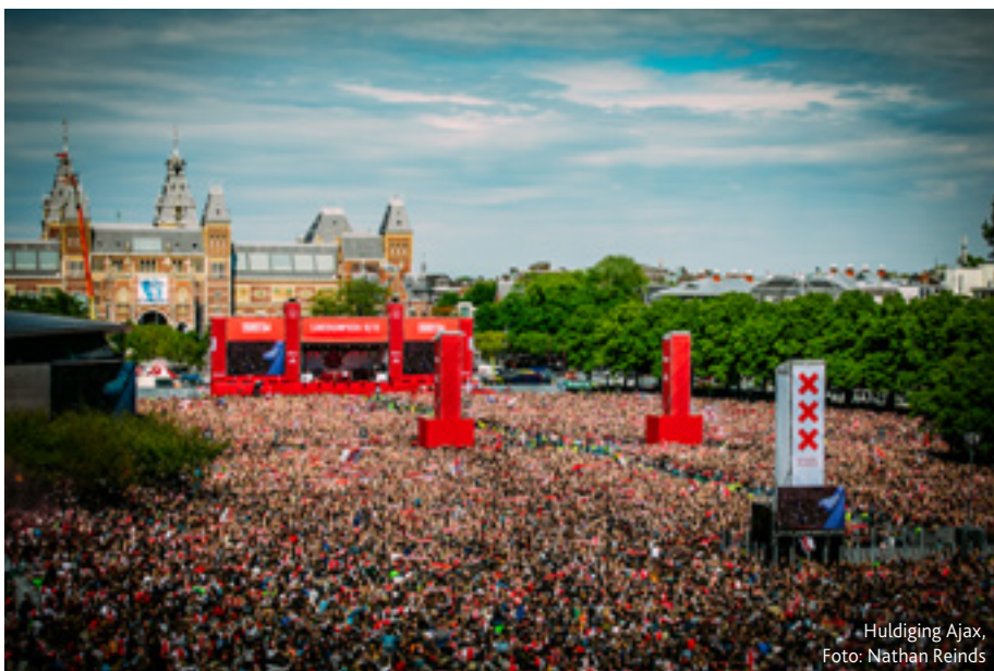
Huldiging Ajax

Het derde label onder de Livetime Experience Group is Unlimited Solutions. “In het verleden is er vanuit Unlimited Productions al een aantal producten ontwikkeld, zoals de BGR70 Truss en de Motion Stabiliser”, legt Monod de Froideville uit. “Het ging altijd om vragen die ontstonden vanuit technische producties en waar nog geen oplossing voor bestond. De BGR70 Truss bijvoorbeeld, die nu ook onderdeel is van het Prolyte spectrum, maar ook de Motion Stabiliser die recent ontwikkeld werd voor Martin Garrix. Voorheen werd dit ondergebracht bij Unlimited Rental, maar daardoor werd je weleens gezien als verhuurbedrijf, waar-