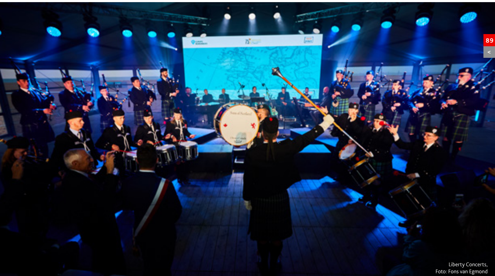
Liberty Concerts