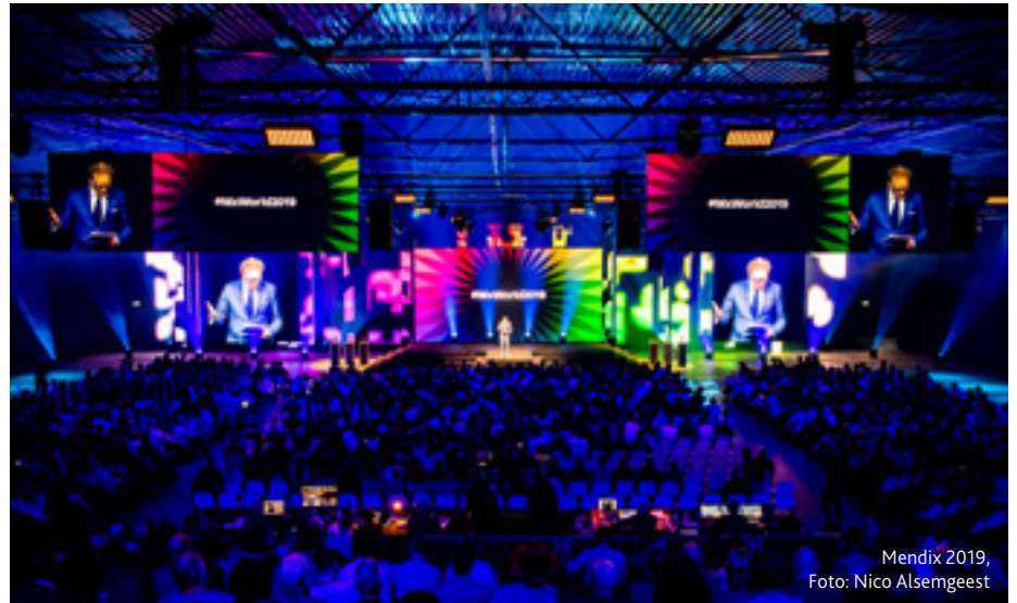
Mendix 2019

Het resultaat is dat onder een holding (overkoepelende strategische groep) met de naam Livetime Experience Group drie labels zijn ontstaan: Unlimited Creatives (creatieve hub en design label), Unlimited Productions (technische- en site productie) en Unlimited Solutions (het innovatielabel binnen de groep). Monod de Froideville: “Onze core business is en blijft technische productie en dat doen we vanaf nu gewoon onder de naam Unlimited Productions. De belangrijkste reden daarvoor is dat dit merk met name internationaal ook al erg sterk is en we juist daar nog veel willen gaan groeien. Natuurlijk blijft Nederland ook belangrijk, maar de groeifocus ligt buiten de landsgrenzen. Uiteraard gebeurt dat allemaal wel zonder Nederland uit het oog te verliezen, ook dat blijft belangrijk.” Het afgelopen jaar werd lang overwogen