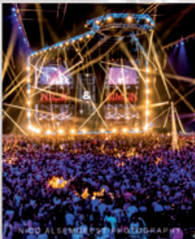
NICK & SIMON ZIGGO DOME