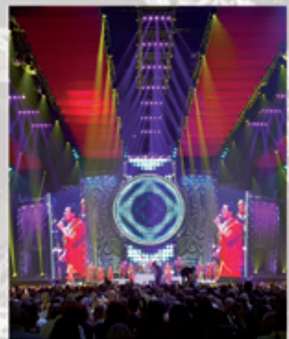
ANDRÉ HAZES ROTTERDAM AHÖY