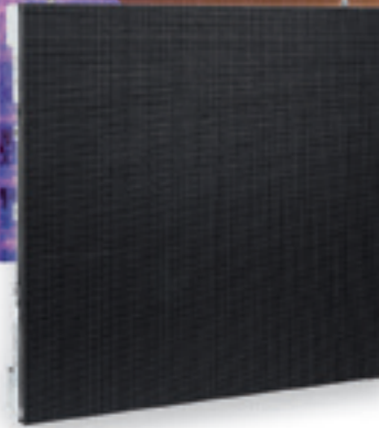
PixelScreen E3.9N Indoor

De PixelScreen E3.9N is een betaalbaar HD-ledscherm met een pixel-pitch van slechts 3,9 mm. Het lichtgewicht, modulaire ontwerp is geschikt voor vele toepassingen. De mechanische aansluiting is snel en eenvoudig dankzij een innovatief snelsluitend systeem. De voedings- en datadoos kan gemakkelijk worden verwijderd voor snel onderhoud. Aan de achterkant van het paneel bevinden zich twee statusleds. Een voor de voedingsaansluiting en een voor de dataverbinding. Voedingsaansluiting door middel van blauwe en witte pluggen. Data via RJ45-aansluitingen. Met ergonomische draaggreep aan de bovenkant.