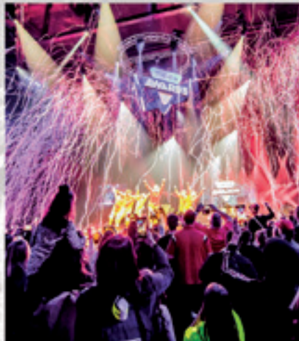
VEED AWARDS 2019 AFAS LIVE