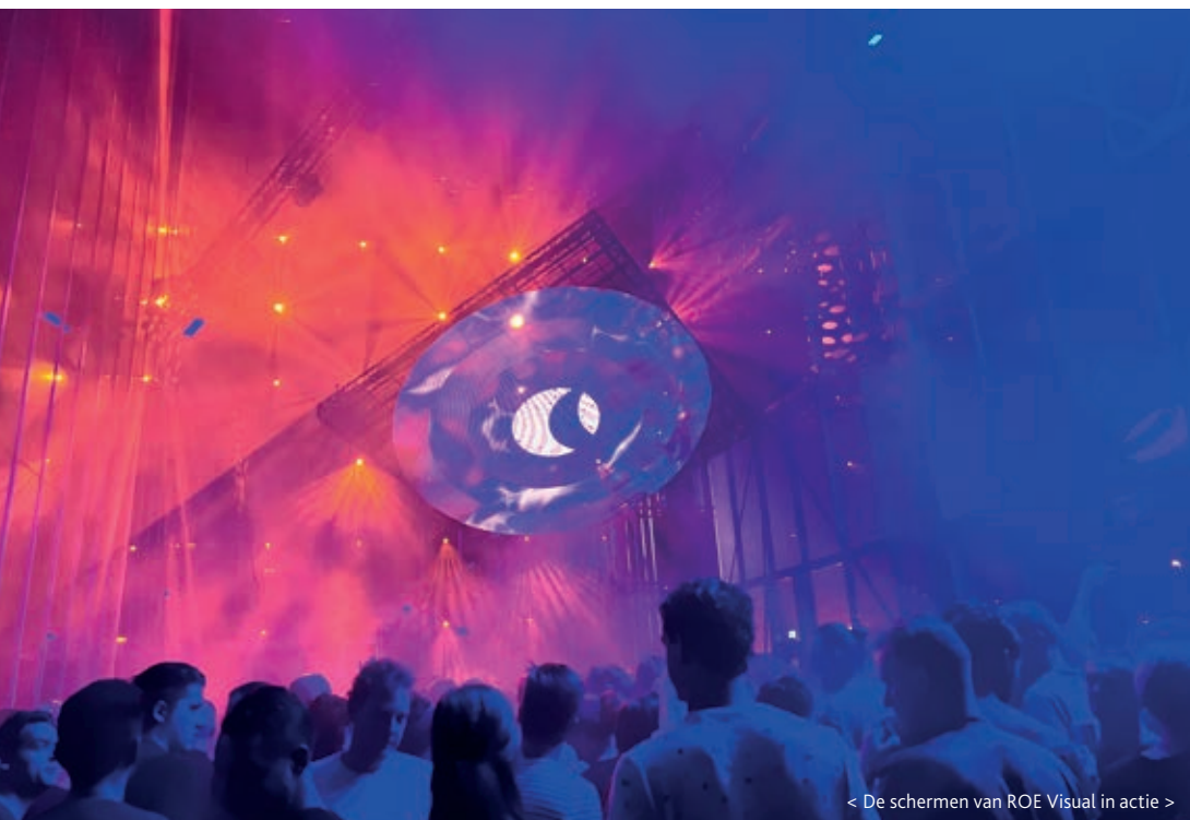
< De schermen van ROE Visual in actie >