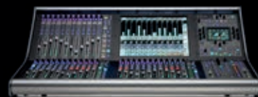
Solid State Logic SOUND || VISION