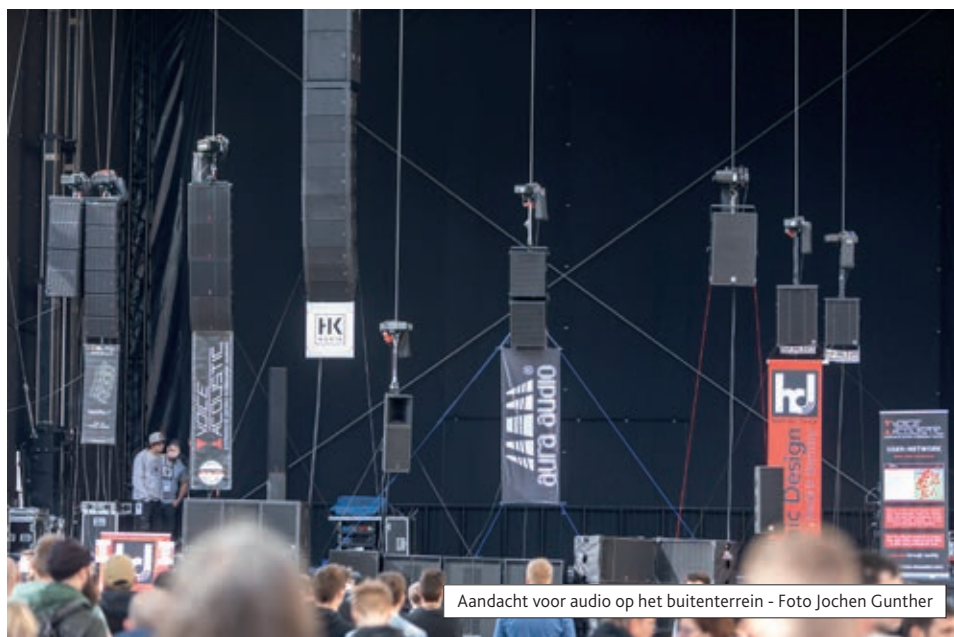
Aandacht voor audio op het buitenterrein