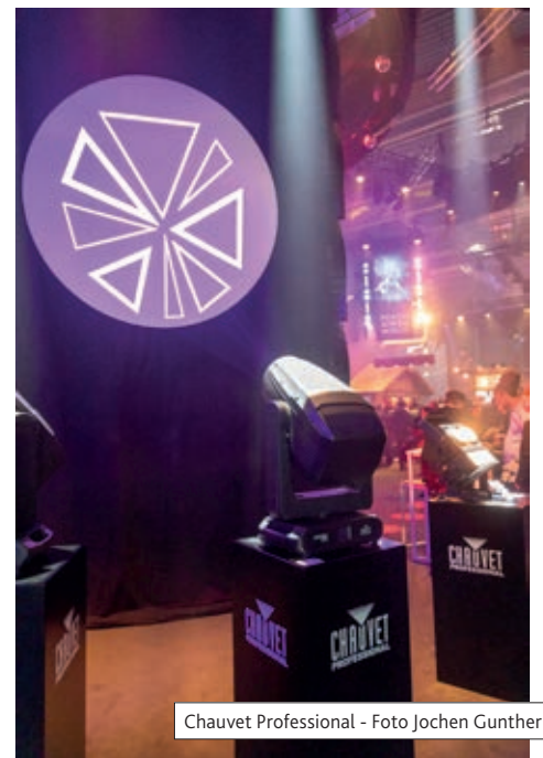
Chauvet Professional