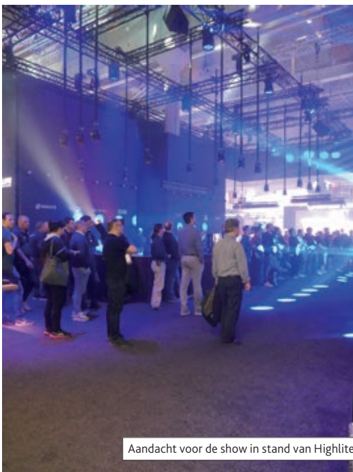
Aandacht voor de show in stand van Highlite