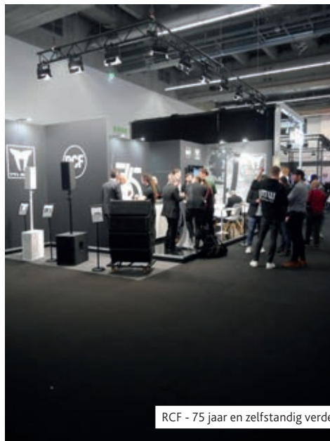
RCF - 75 jaar en zelfstandig verder