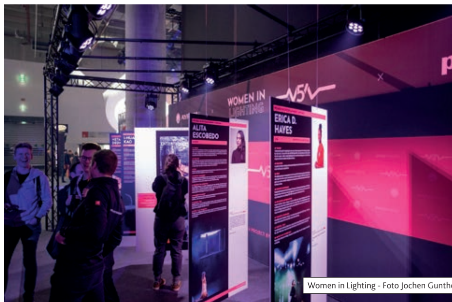
Women in Lighting

Een verslag van alles wat op de beurs te zien was is niet mogelijk. Selectie is een noodzakelijk kwaad. Wel kunnen we concluderen dat Prolight + Sound de moeite van het bezoek zeker waard was, zelfs in een jaar waarin we ook al CUE en ISE bezochten. <