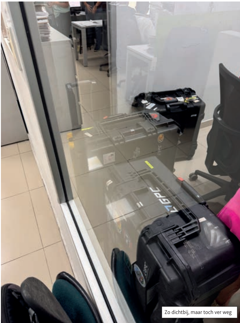
Zo dichtbij, maar toch ver weg

is ook de steun van thuis essentieel”, geeft hij aan. “Zonder die thuisbasis was SkyLynx een heel ander bedrijf. En tijdens de zware momenten in Colombia waren het mijn vriendin en kinderen die me dankzij Starlink af en toe een duwtje in de rug gaven. Dan zit je er doorheen en hoor je aan de andere kant van de wereld je kinderen zeggen: ‘het komt wel goed, papa’. Dertig dagen Colombia... ik heb na afloop gezegd dat ik zo'n productieperiode niet nog een keer ga doen, maar eerlijk? Als het me over een tijdje weer gevraagd wordt, kan dat zomaar weer anders zijn.” ◀