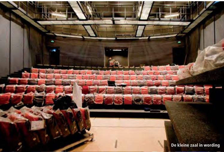
De kleine zaal in wording