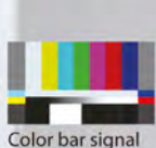
Color bar signal

The VC-1 series faithfully converts the original source with no change in color or brightness. It supports super-blacks and super-whites, and converts video from cameras and other source devices with all the originality intact.