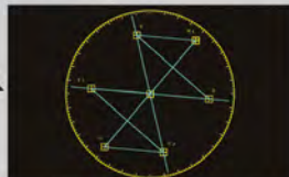
Faithful conversion of color phase and chroma