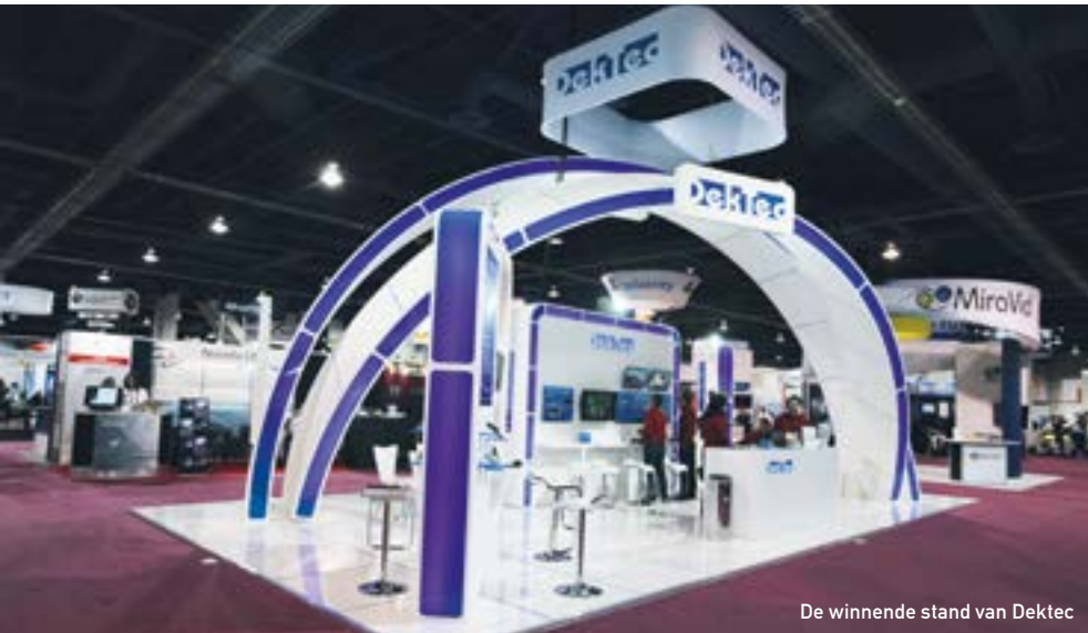
De winnende stand van Dektec

handvatten en schouderstatieven voor kleinere spiegelreflexcamera's te zien tijdens de NAB show. De Amerikaanse markt wordt veroverd met behulp van een Amerikaanse vertegenwoordiger van Vocas en is erg belangrijk voor het bedrijf, met name vanwege de royale Amerikaanse filmindustrie.